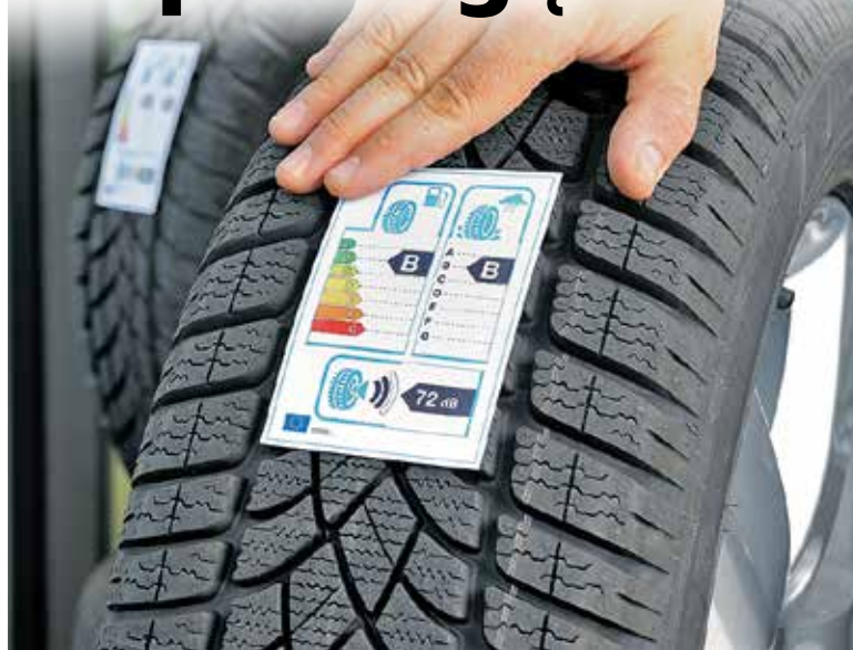
Nuo 2012-ųjų Europos Sąjungoje parduodamos padangos pradėtos ženklinti naujomis etiketėmis, ant kurių nurodyti trys parametrai: pasipriešinimas riedėjimui, stabdymas ant šlapios kelio dangos ir sklaidžiamas triukšmas.

Jei gyvenate šalia miesto, dažnai tenka važiuoti prastai valomais ir apledijusiais žvyrkeliais, etiketėje nurodyti kriterijai yra antraeiliai, kur kas svarbesnės padangų savybės ant sniego ar ledo dangos. Todėl, norint išsirinkti geriausią apavą automobiliui, rekomenduojama pasitarti su parduotuvėje dirbančiais specialistais – jie padės rasti geriausią kainos, ko-