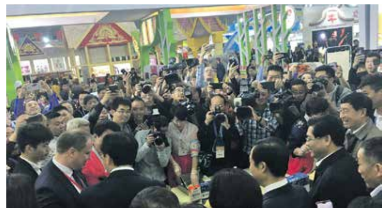
Lietuvos ekspozicija buvo viena iš trijų, kurias bendrai aplankė visų užsienio šalių oficialios delegacijos ir Kinijos pareigūnai.

Statistikos departamento duomenimis, šiuo metu iš žemės ūkio ir maisto produkcijos lietuviai į Kiniją