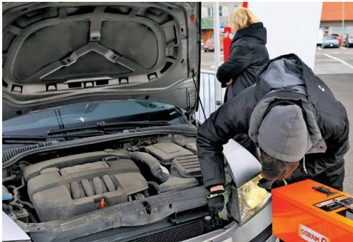
Iš pusės tūkstančio patikrintųjų vos 119 automobilių (tik ketvirtadalis) turėjo tinkamai sureguliuotus žibintus, beveik kas penktam automobiliui reikėjo poliruoti žibintų stiklus.

Suvedimas – vienas iš svarbiausių pakabos parametrų, da-