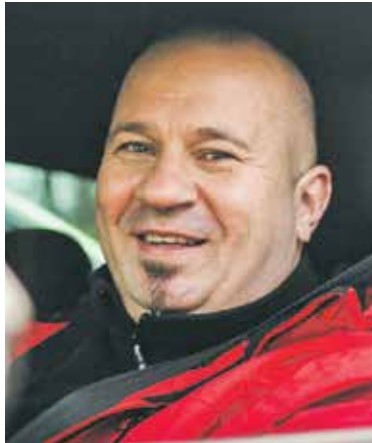
J.Paplaitis: „Vairuotojams jau dabar patarčiau užsukti į artimiausią servisą, kad būtų nustatyta akumulatoriaus būklė ir jo krovimo lygis, tada spustelėjus šaltukui neteks kvieštis pagalbos ir gaišti laiko norint paleisti variklį.“

„Įvertinus tą aplinkybę, kad čia nesilankė vairuotojai, kurie žino, kad važinėja netvarkingu automobiliu, galima įsivaizduoti, kokia yra