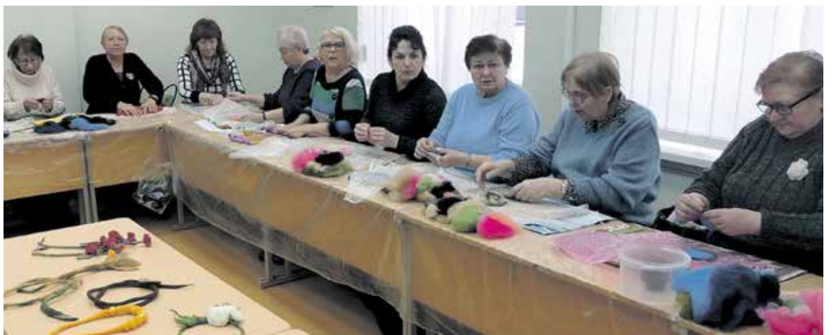
Kol dar nevelė muliažų, moterys iš vilnos jau buvo pagaminusios kambarinių šlepečių, papuošalų.