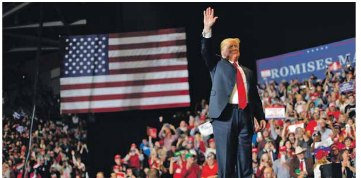
D.Trumpas rinkimų išvakarėse demonstravo pasitikėjimą ir ryžtą.