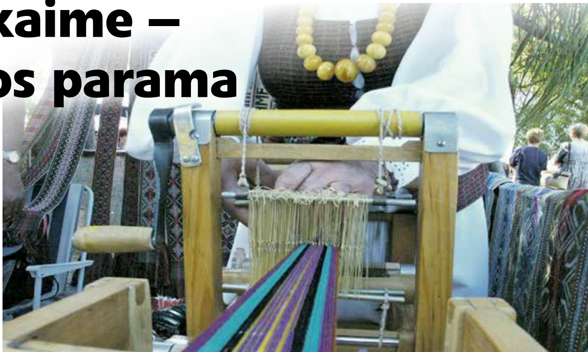
Savo verslą pradedančiam žmogui ES pasirošusi kompensuoti nors dalį jo verslo rizikos, nes kaimo gyventojai, neužsiimantys žemės ūkiu, yra ta grupė žmonių, kuriems itin reikalinga pagalba.

Kaip sėkmingą tokios veiklos pavyzdį jis paminėjo viename Švedijos kaime įsikūrusią nedidelę įmonę, kuri pradėjo gaminti įvairius kremus ir tepaliukus. Netrukus šį imonėlę tapo žinoma ne tik šioje šalyje, bet ir visoje Europoje kaip ekologiško kremo gamintoja. A.Svitojaus nuomone, tokiam verslui pradėti 16 tūkst. eurų parama gali tapti ne-