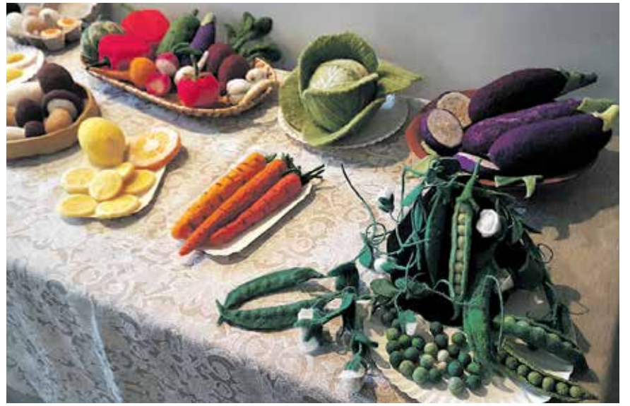
Studentės senjoros iš vilnos nuvėlė ne tik šoninę, lašinius, keptus kiaušinius, bet ir batoną, kopūstą, vaisius, tortus, saldinius.