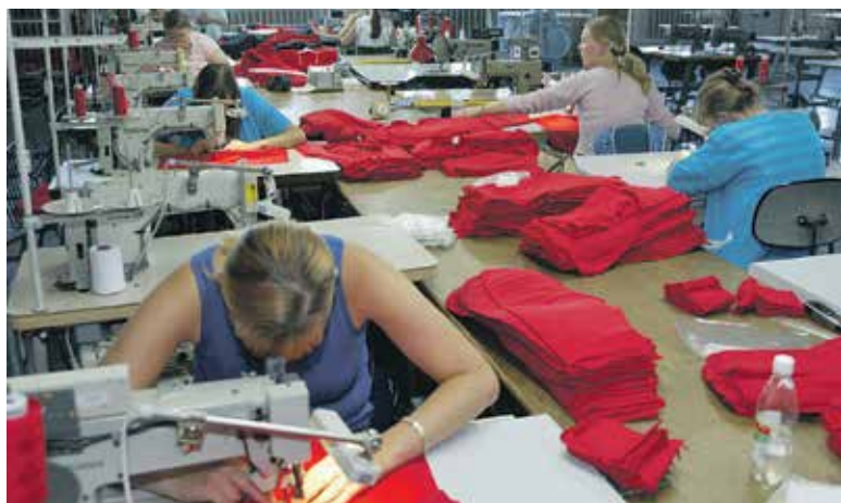
Kaime galima užsiimti įvairiausių verslais – nuo tradicinių amatų iki siuvinimo paslaugų, mašinų remonto ar kavinių, restoranų. Svarbu, kad kaimuose pradeda- mas verslas kurtų pridėtinę vertę – duotų pajamų.

Lietuvoje yra nemažai smulkiojo verslo sričių, kurios puikiai gyvuoja ir, be to, sėkmingai skinas kelią užsienio rinkose, nes pasaulio rinkoje smulkioji produkcija, ypač rankų darbo, turi didelę paklausą. Turint