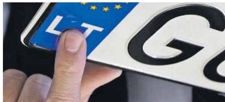
Jei pametėte arba sugadinote numerio ženklus, turite nedelsdami kreiptis į „Regitra“, kad būtų išduoti nauji arba dublikatai.

Radus pamestą transporto priemonės numerį, jį galima grąžinti savininkui dviem būdais: pirmasis – perduoti „Regitrai“, kuri jį grąžins savininkui, antrasis būdas – atiduoti policijai. Ši numerio žen-