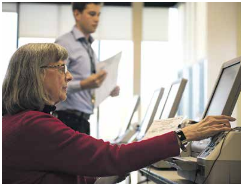
Amerikietė prie balsavimo mašinos rinkimų apylinkėje.

Kad ir kaip būtų, JAV rinkėjų bandymas – sėkmingas ar ne – uždėti Kongrese politinį apynasrį D.Trumpui turės svarbių pasekmių ne tik Amerikos vidaus, bet ir užsienio politikai. O tai reiškia, kad per kadencijos vidurio rinkimus kažkur Ohajuje ar Šiaurės Karolinoje atiduoti paprastų amerikiečių balsai gali vienaip ar kitaip atsiliiepti ir tarptautiniams Lietuvos reikalams. Tikėkimės, kad teigiamai.