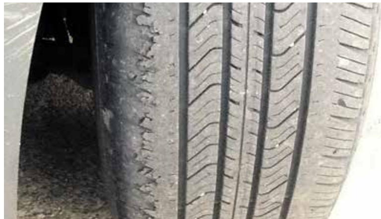
Netolygiai nudilusios padangos rodo, kad daugybės suremontuotų automobilių kėbulų, kurie buvo pažeisti avarijose, geometrija buvo netinkamai atkurta.

Lietuvoje aktyviausi vairuotojai buvo Kaune, čia, kaip ir kitur (ne Vilniuje), atvažiavo vien tik dyzeliniai automobiliai – tik Vilniuje patikrinti būklės atvyko ir benzinių mašinų.