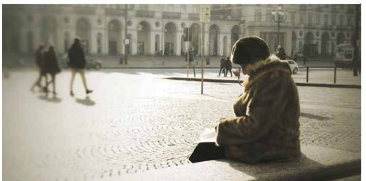
Daugumai žmonių trūksta galimybės būti išklaustytiems ir suprastiems.